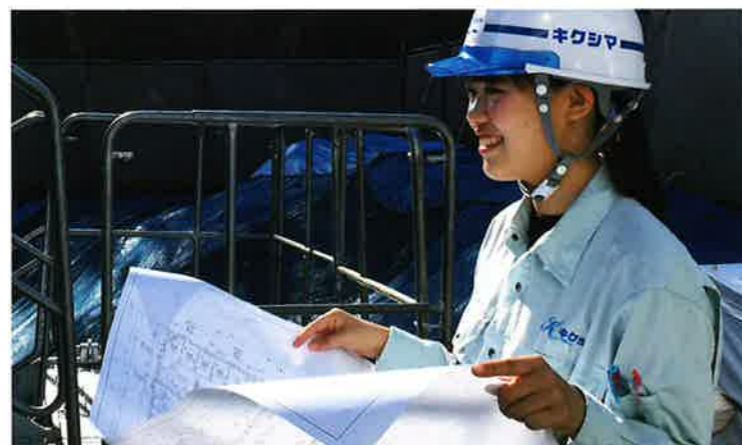
建築工事部 現場監督

まずは目の前のことに精一杯取り組むことで、 ちょっとでもその姿に近づけますように！